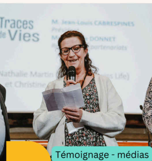
Témoignage - médias

ayant pour attente de participer à la mobilisation collective ou de partager leur expérience ont adhéré au Collectif Je t'Aide suite à l'action suivie