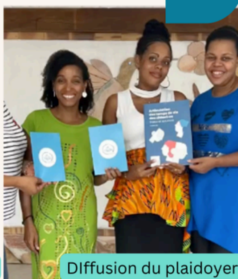
Diffusion du plaidoyer