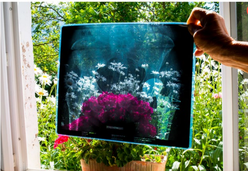
Voir au-delà des choses

Visible en accès libre jusqu'au de fin septembre à fin novembre sur les grilles du Palais d'Iéna - Siège du Conseil Économique Social et Environnemental (CESE), le long de l'Avenue Albert de Mun, l'exposition du Club Landoy réunit le travail photographique de Lucas Frayssinet , Nadine Barbançon et Audrey Guyon pour mettre en lumière le quotidien de ceux et celles qui aident et la nécessité de reconnaître leur importance en veillant à leur bien-être, tant physique que mental. Les quatre séries présentées illustrent l'impact de l'aide sur le quotidien, tout en soulignant la multiplicité des réalités et en témoignant du lien particulier, entre soin et sollicitude, qui unit les aidants à leurs aidés. Loin des clichés.