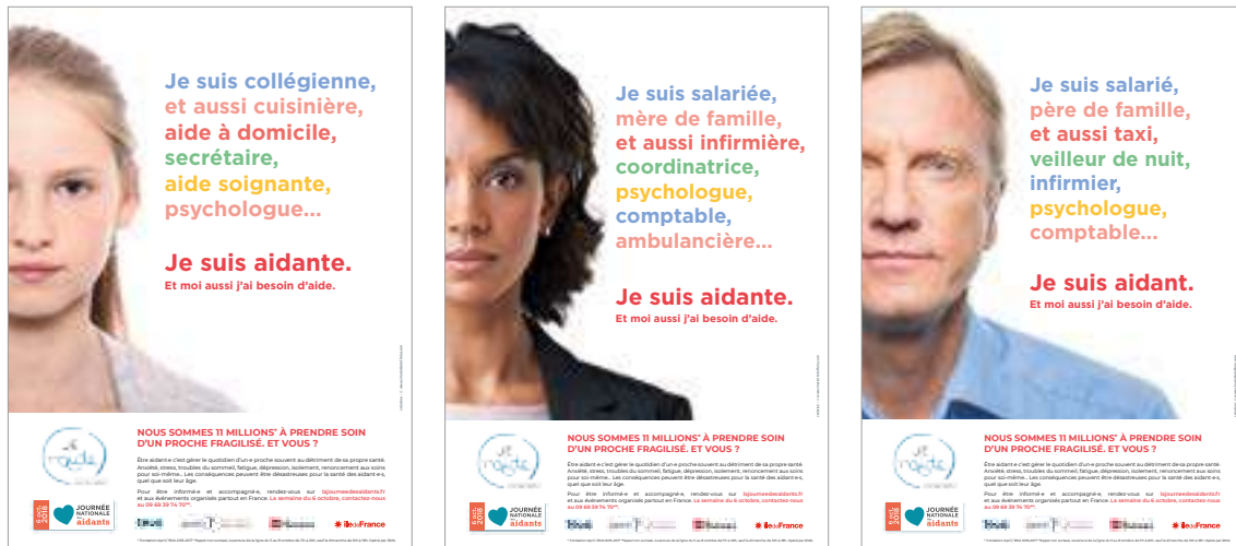
Campagne de communication de Je t'Aide. 2018

L'aidance est un travail sans rémunération ni droits. Ce travail va même jusqu'à précariser l'aidant.e qui l'exerce car il.elle devra souvent diminuer son temps de travail rémunéré (et par conséquent ses revenus), parfois s'arrêter de travailler, et donc moins cotiser à la retraite, tout en payant le reste à charge lié à la perte d'autonomie de sa son proche. L'articulation entre aidance et précarité est donc évidente. L'aidant.e, par ailleurs, n'est pas en situation de choix réel : devant l'assignation culturelle, très liée au genre, et l'assignation institutionnelle (le "vous prendrez soin d'elle / de lui" prononcé par les professionnel.le.s de santé, les institutions, etc), il.elle est obligée d'aider. L'assignation, l'invisibilité, le.la privent du choix et de la parole.